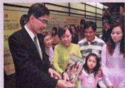
▲社區一家贊助計劃促進族群融合，讓外籍婦女融入台灣社會，由被動變助人。